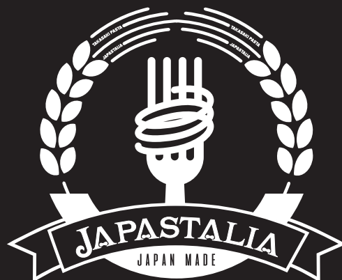
モノクロリバーズ表示